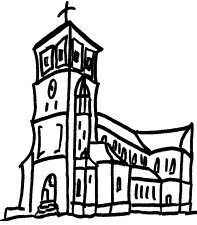
St. Josef Gaggenau